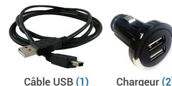
Câble USB (1)

Branchez l'ODO10 avec les accessoires fournis (câble USB (1) et le chargeur (2)) dans l'allume-cigarette.